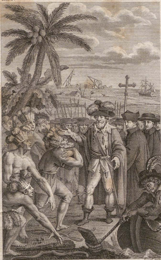
Arrivée au Brésil de Don Thomé de Souza, premier Gouverneur général. P. 134.