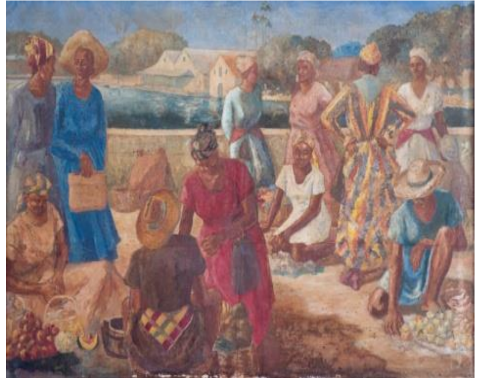
Le marché Sans date (Années 1950), Huile sur toile