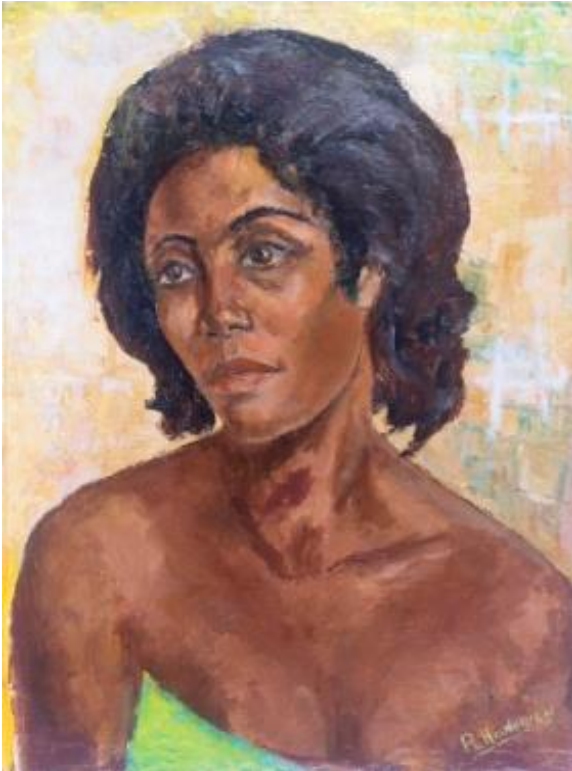
Portrait 1968, Huile sur toile