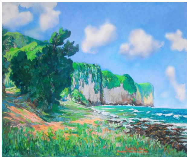
Pointe Canicule, Basse-Pointe 1981, Huile sur bois 96 x 121 cm