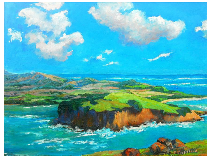
Pointe Marée et vue sur le Cap Macré 1967, Huile sur bois 48 x 59 cm