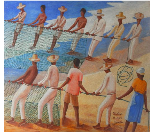
Coup de senne 1998 Acrylique sur bois 81x61 cm