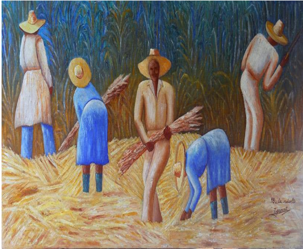
La récolte 1998 Acrylique sur bois 51x98 cm