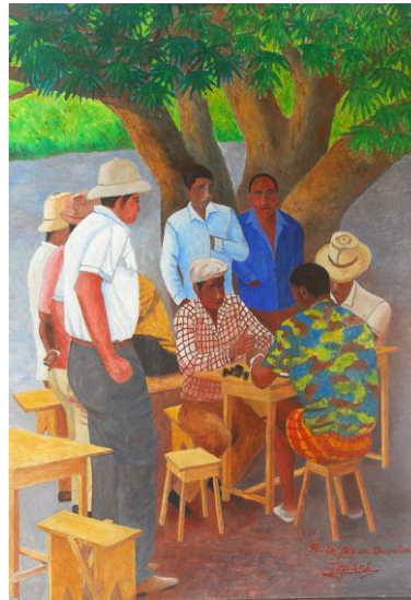
La fête au quartier 1998 Acrylique sur bois 81 X 61 cm