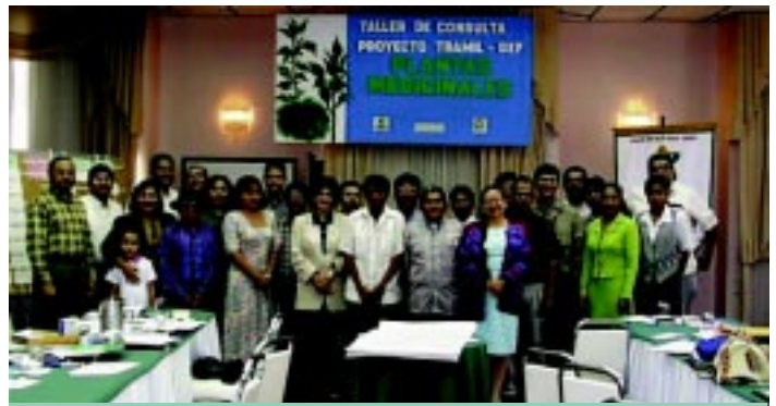
Participantes del Taller de consulta Panamá 4-5 de enero del 2000

Localidad: Hotel Granada, Ciudad de Panamá