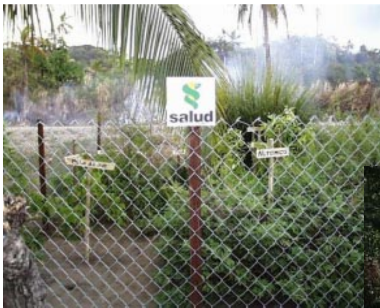
Jardín en el Centro de Salud de Miramar, Panamá.