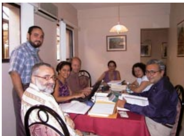
Grupo de especialistas revisores de la Farmacopea Vegetal Caribeña.