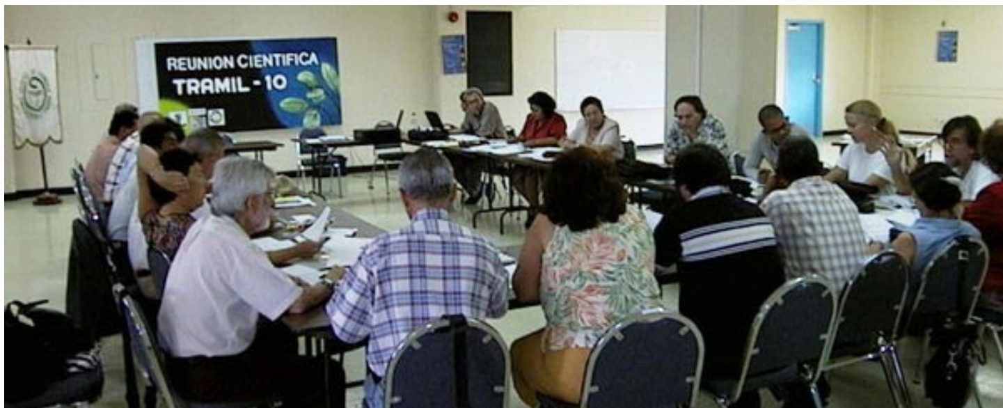
Reunión Científica TRAMIL. Ciudad de Saber, Panamá. Marzo 2001.

En el marco de la reunión técnica denominada Reunión Científica TRAMIL X realizada del 05 al 09 de marzo de 2001 en Ciudad del Saber, Panamá, se desarrolló los días 08 y 09 la revisión y análisis del proceso operativo del Programa TRAMIL, en donde se redefinió la Visión y Misión del Programa TRAMIL.