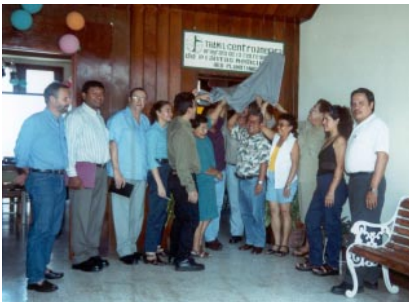
Develización de rotulo de Oficina TRAMIL-Centroamérica y RED PLAMOTANIC. Edificio del AÑO COMÚN, UNAN-León, 14 de junio de 2001.

A partir de abril de 2001 la Oficina de Coordinación TRAMIL-Centroamérica se encuentra en las instalaciones del AÑO COMÚN de la Universidad Nacional Autónoma de Nicaragua – León (UNAN-León). Con el traslado de esta Oficina se instala en el mismo edificio la Oficina sede de la Red Nicaragüense de Sistemas Tradicionales de Salud con Plantas Medicinales y Otras Terapias Alternativas (RED PLAMOTANIC). El 14 de junio del presente se realizó la reinauguración de Oficina TRAMIL-Centroamérica / UNAN-León y apertura de Oficina de Sede RED PLAMOTANIC. Desde aquí se continúan realizando las actividades monitoreo y difusión. Con el estrecho vínculo y cercanía de ambas Oficinas, ha sido posible poner en corto tiempo en la Internet, la apertura de la primera página WEB de la RED PLAMOTANIC. Describiéndose el nacimiento y los objetivos que se persiguen, publicación de boletín electrónico, membresía de la red, etc. La página en mención puede ser visitada en: http://www.ibw.com.ni/u/planmed