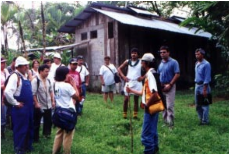
Técnicos de 13 países de América Latina, del CURSO INTERNACIONAL DE MANEJO DE BOSQUES - D.S.E., visitaron el Jardín para realizar un análisis de las actividades de Educación Ambiental con las plantas medicinales TRAMIL.

Durante septiembre – octubre del 2000, se realizó el primer curso corto: Manejo y Conservación de Plantas Medicinales , con el apoyo y participación del Colegio Técnico de Batán. Para su ejecución se presentó un documento de base con objetivos y metodología para implementar un modelo de acercamiento al tema de conservación y manejo, entregado a los participantes. El curso contó con la participación de 14 estudiantes de Décimo Año, del curso de Agroecología del Colegio Técnico de Batán. El curso se desarrolló en dos días con dos secciones, una teórica que se realizó en el Colegio y la otra práctica, que se realizó en el Jardín Agroecológico.