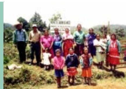
Pobladores de Santa Cruz de Pazguare, Guajiquiro La Paz, Honduras, en el huerto medicinal

Durante los meses de marzo a mayo 2001, haciendo uso de la técnica de agricultura orgánica, el CIMN-H TRAMIL brindó capacitación y apoyo técnico sobre cultivo, cosecha y recolección de plantas medicinales a los beneficiarios del proyecto. Participaron 22 personas de las comunidades de Santa Cruz de Pazguare y Tamara del Municipio de Guajiquiro. Con la participación de 15 pobladores entre hombres y mujeres, se hizo la instalación de un jardín de 7,500 varas cuadradas, compra de herramientas, material de cerco y riego. Para el cuidado de este nuevo jardín se eligió un comité de seis integrantes que dan monitoreo y mantenimiento. Las plantas sembradas fueron: Artemisia ludoviciana , Zingiber officinale , Achillea millefolium , Ruta chalepensis , Chenopodium ambrosioides , Tanacetum parthenium , Eupatorium daleoides , Polipodium aureum , Verbena litoralis , Petiveria alliacea , Sambucus mexicana y Cymbopogon citratus .